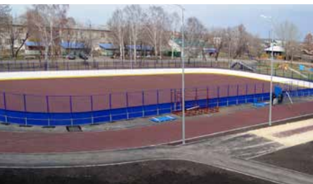
г. Ивдель, ул. Данилова, 132, СОШ №1 (9)