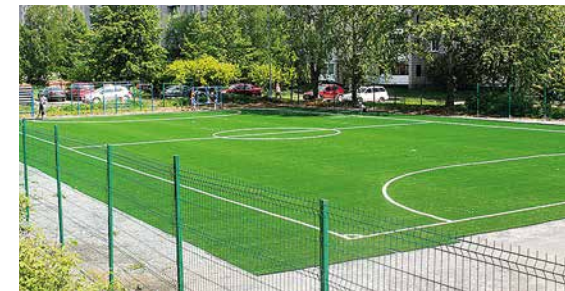
г. Нижняя Тура, спортивная площадка (7)