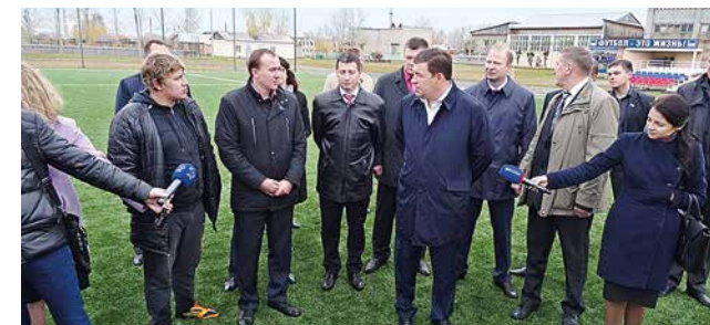
Губернатор Свердловской области Е.В. Куйвашев на открытии футбольного поля п. Цементный (4)