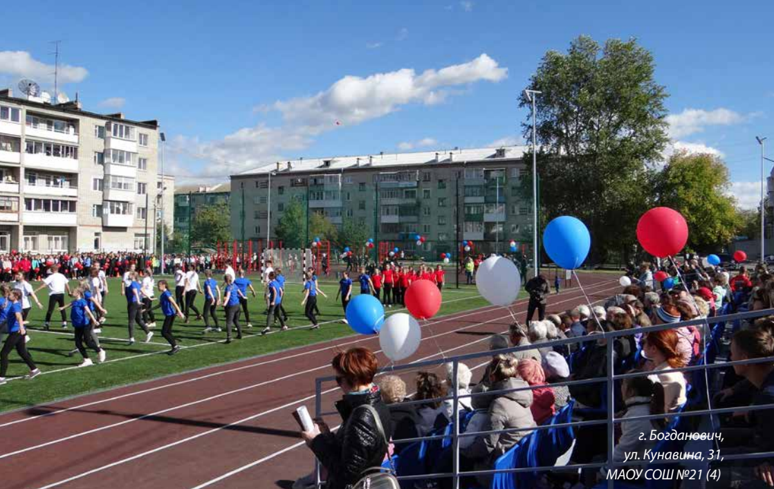
г. Богданович, ул. Кунавина, 31, МАОУ СОШ №21 (4)