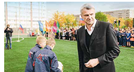
Глава г. Нижнего Тагила С. К. Носов на открытии стадиона школы №69 (4)