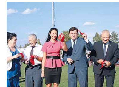
Губернатор Свердловской области Е.В. Куйвашев на открытии стадиона в г. Нижняя Тура (10)