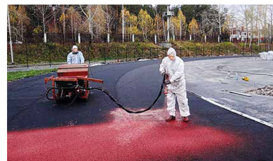
Напыление крошки ЕПДМ на беговые дорожки