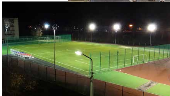
г. Сухой Лог, ул. Юбилейная, 29А, МАОУ СОШ №17 (10)

В 2018 году группой компаний «Березит» выполнены работы по реконструкции и строительству 14 стадионов и на территории Свердловской области. Общая площадь уложенного искусственного травяного покрытия составляет 21 738 кв.м, резиноналивного покрытия беговых дорожек и спортивных площадок – 27 995 кв.м