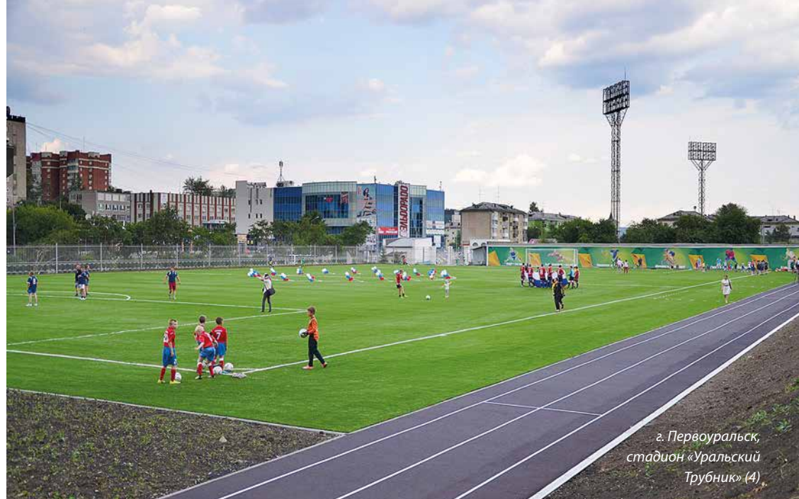
г. Первоуральск, стадион «Уральский Трубник» (4)

11 Свердловская область, Ачитский городской округ, пос. Уфимский, ул. Специалистов, 12. Школьный стадион: беговые дорожки 1 610 кв. м.