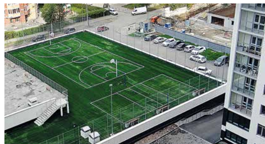
г. Екатеринбург, ЖК «Крылов» (1)