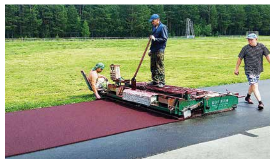
Укладка резинового покрытия беговых дорожек