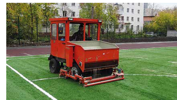
Засыпка и вчесывание песка в искусственную траву