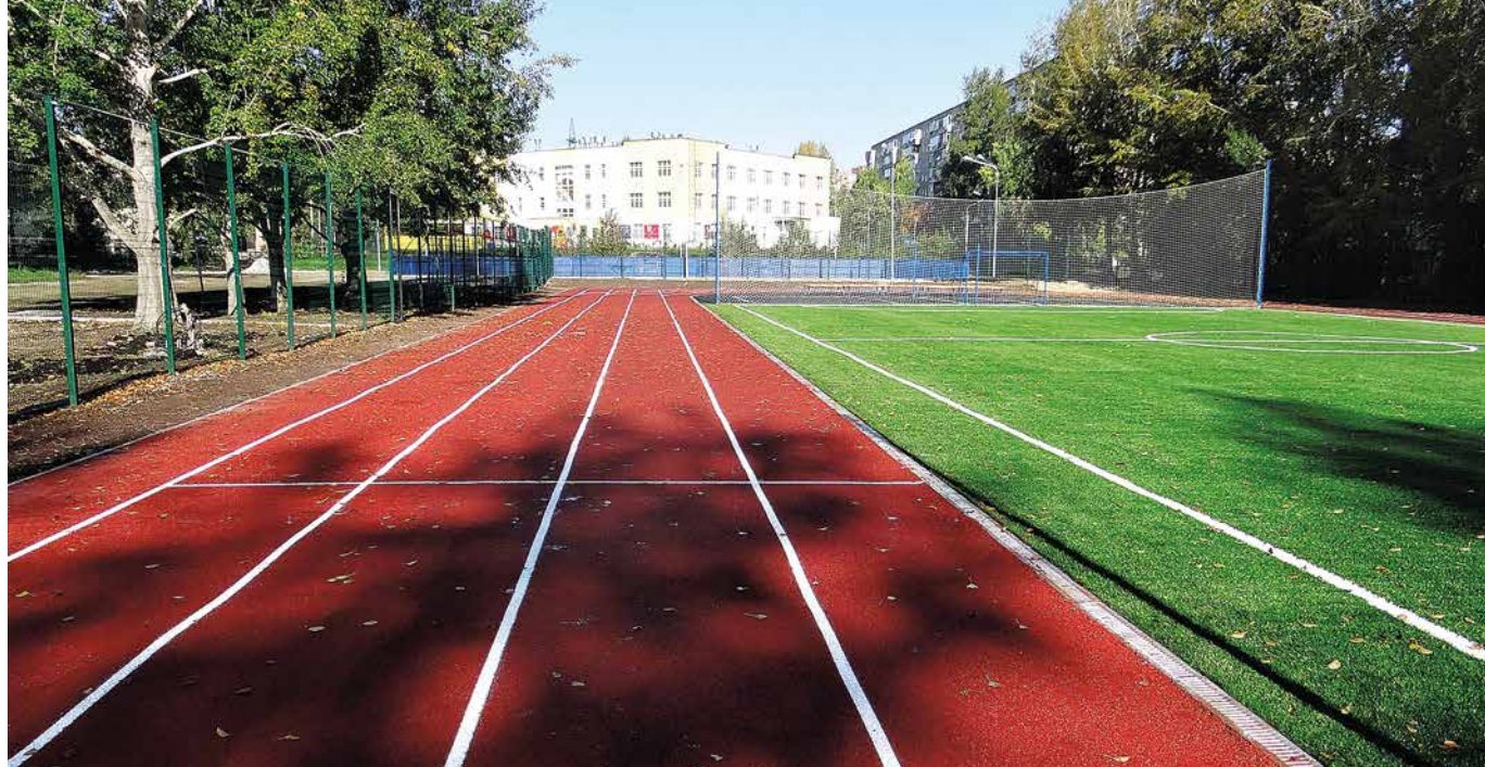
г. Екатеринбург, средняя школа № 4 (2)

г. Нижний Тагил. Комплекс трамплинов «Аист» (3)