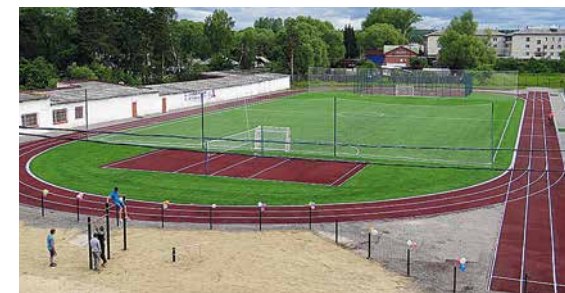
пос. Пионерский Талицкого района (7)