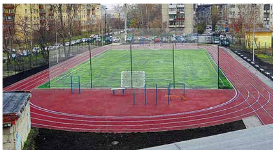
г. Екатеринбург СОШ №14 (2)