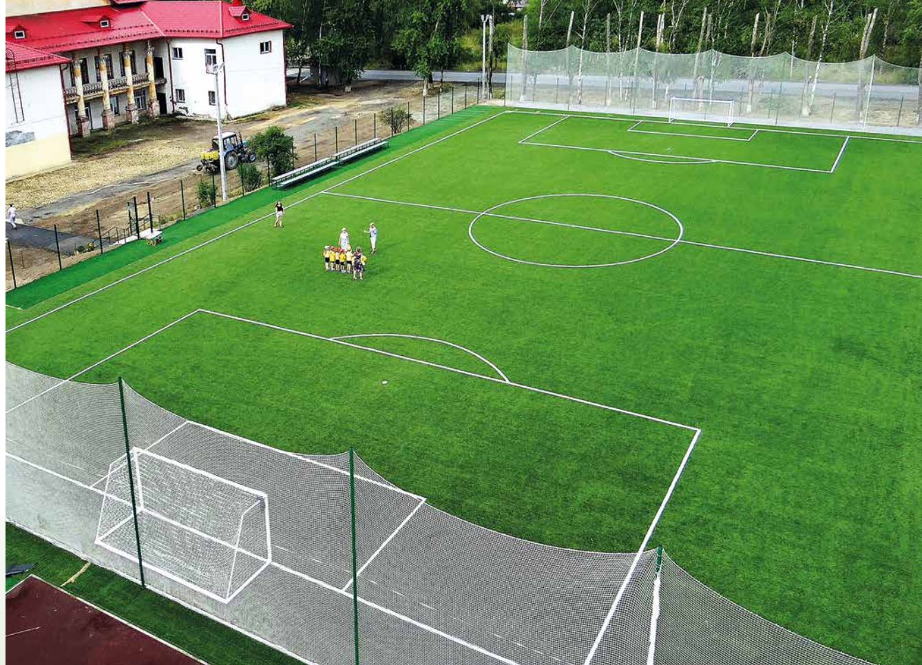
г.Нижний Тагил, стадион школы №34, 2016 г.

ГК «Березит», являясь региональным представителем компании «COCREATION INTERNATIONAL TRADE CO.,LTD», располагает самым крупным на Урале складом футбольной искусственной травы с высотой ворса 20, 40, 50, 60 мм по максимально выгодным ценам.