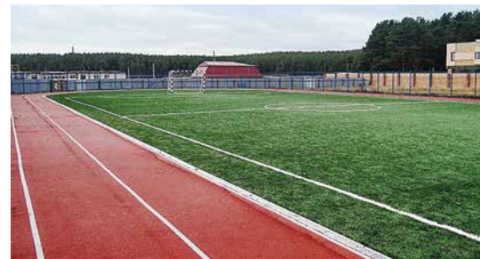
г. Сысерть, Кадетская школа- интернат (6)