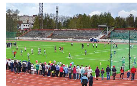
г. Асбест, стадион «Ураласбест» (5)