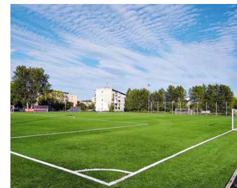
г. Нижняя Тура, ул. Декабристов, 23, СОШ № 2 (9)