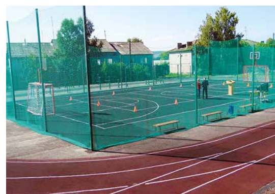
г. Красноуфимск, ул. Нефтяников, 12, МКОУ ОШ № 4 (6)