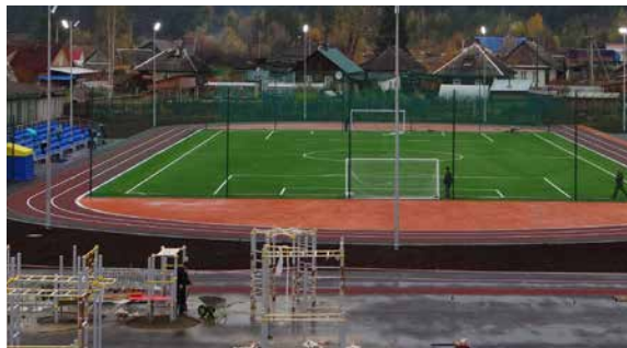
Алапаевский район, с. Коптелово, ул. Красных Орлов, 52, МОУ «Коптеловская СОШ» (11)